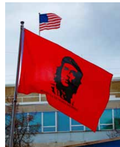
Dyst mellem socialisme og imperialismen kan også se sådan ud.

Den 11. juli og i dagene derefter var der uro i Cuba. Kontrarevolutionære kræfter i Cuba og i udlandet – ikke mindst USA – udnyttede en alvorlig mangelsituation til at organisere protester, som endte i alvorlige episoder med vold og plyndringer. En forståelig frustration over mangel på mad, medicin, el og brændstof blev udnyttet til at rejse krav om regeringens afgang og et systemskifte.