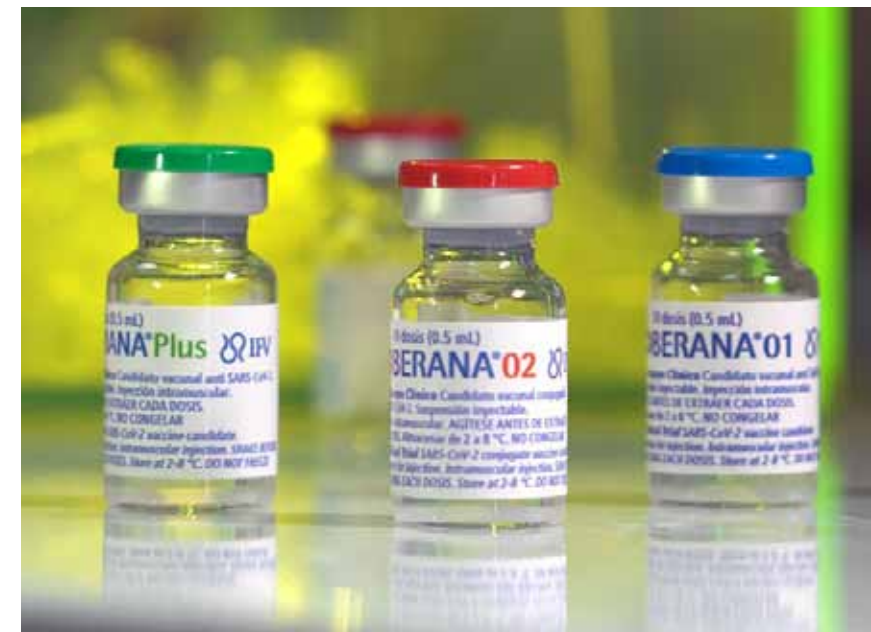
Vaccinekandidaten Soberana 01 var den første, som kom ind i et testprogram, men i løbet af få måneder blev den overhalet af en anden vaccine med navnet Soberana 02, som i dag er den ene af 3 vacciner, der er godkendt til brug i Cuba.

Vestlige regeringer fortsætter med at modsætte sig opfordringer fra det globale syd om at give afkald på vaccinepatenter og give fattige lande mulighed for at fremstille eller købe billigere generiske versioner. Det efter-