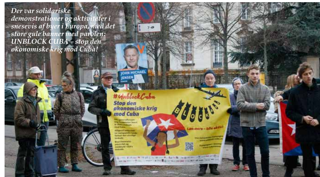
Der var solidariske demonstrationer og aktiviteter i snevejs af byer i Europa, med det store gule banner med parolen: UNBLOCK CUBA – stop den økonomiske krig mod Cuba!

Nabila Massarali, talskvinde for EU-udenrigskommissær, Joseph Borrell sagde, at man afventer en forklaring fra de cubanske myndigheder.