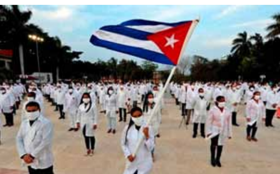
4.000 cubanske sundhedsarbejdere har støttet læger i 40 lande i deres kamp mod COVID-19. Henry Reeve Brigaderne har arbejdet siden 2005 og hjulpet næsten fire millioner mennesker i 45 lande

Det Oslo-baserede Nobeludvalg oplyser, at de har haft det tredjestørste antal kandidater nogensinde med mere end 329 kandidater, heraf 234 personer og 95 organisationer nomineret.