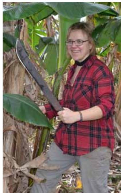
Brigadens program omfatter normalt 6-7 halve arbejdsdage. Nogle gange får brigadisterne mulighed for at svinge den store sukkerkniv – »machten«.

Undersøgelser af det cubanske samfund: Virksomheds- og institutionsbesøg, foredrag, film, debatter m. m. Deltagerne kommer tættere på det cubanske samfund end det er muligt som turist i landet.