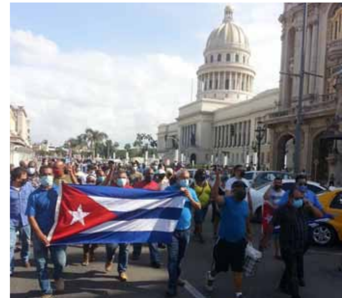
Titusinder af cubanere svarede igen med mod-demonstrationer i byer over hele landet. Her fra Havana.

uden for Cuba som uophørligt arbejder for et systemskifte.