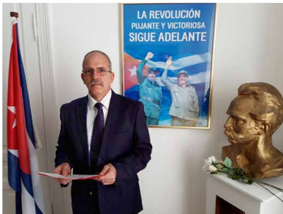
Cuba har været offer for en mediekampagne, der voksede ud af konti baseret i Nordamerika. Hashtagget #SOSCuba giver os mulighed for at fastslå, at protesterne blev opmuntret som en del af den fjerde-generations krig, som den amerikanske regering fører mod Cuba.