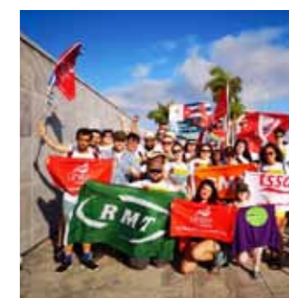
Britisk fagbevægelse er meget aktiv med Cuba-solidaritet. Her delegationer fra en række britiske fagforeninger til 1. maj i Havanna i 2019.