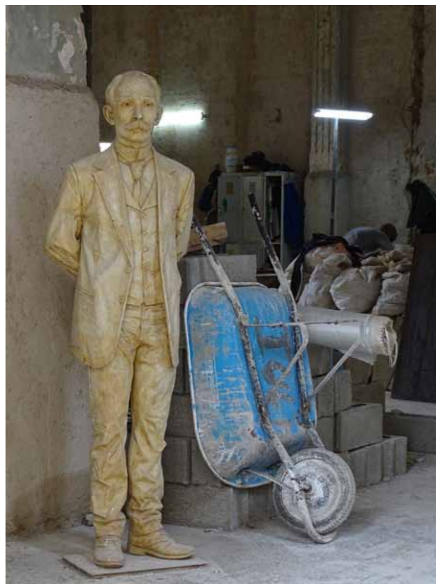
Statue af Jose Martí.

Indtil Østblokkens sammenbrud var der kun begrænsede underskud på den cubanske varehandel med udlandet, da kunne man altså godt brødføde befolkningen uden at importere