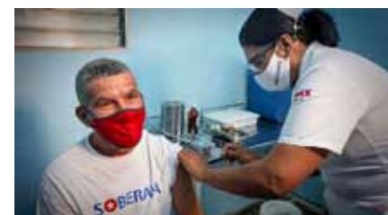
Den europæiske indsamling har bidraget med 6 millioner sprøjter og kanyler. Det dækker 20-25 procent af Cubas behov for corona-vaccinationer.

Dr. Cavalli fortæller begejstret, at der er indsamlet over 600.000 euro (over 4 millioner kroner) i kampagnen »Syrenes to Cuba« som direkte