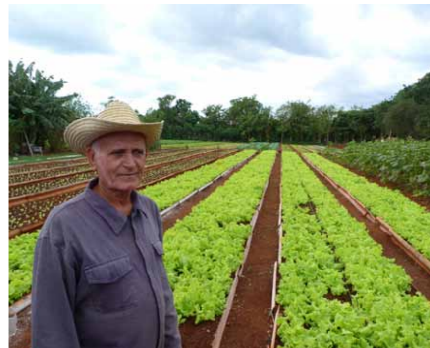
Cuba sætter alle kræfter ind på at få flere til at arbejde mere, producere mere og skabe mere værdi.