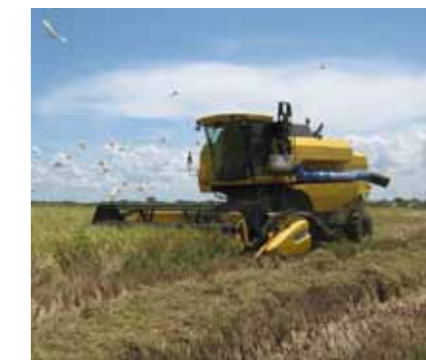
Cubas pensionister opfordres til at supplere pensionen ved at arbejde.

blandt cubanere, der ikke havde adgang til USD, og mange af disse (ofte unge) valgte at droppe både studie og arbejde, men når staten samtidig stod for alle de tunge udgifter (uddannelse/sundhedssystem samt mange goder og services til stærkt subsidierede priser), blev de statslige udgifter (der var tænkt som en ligelig omfordeling af samfundets indtæg-